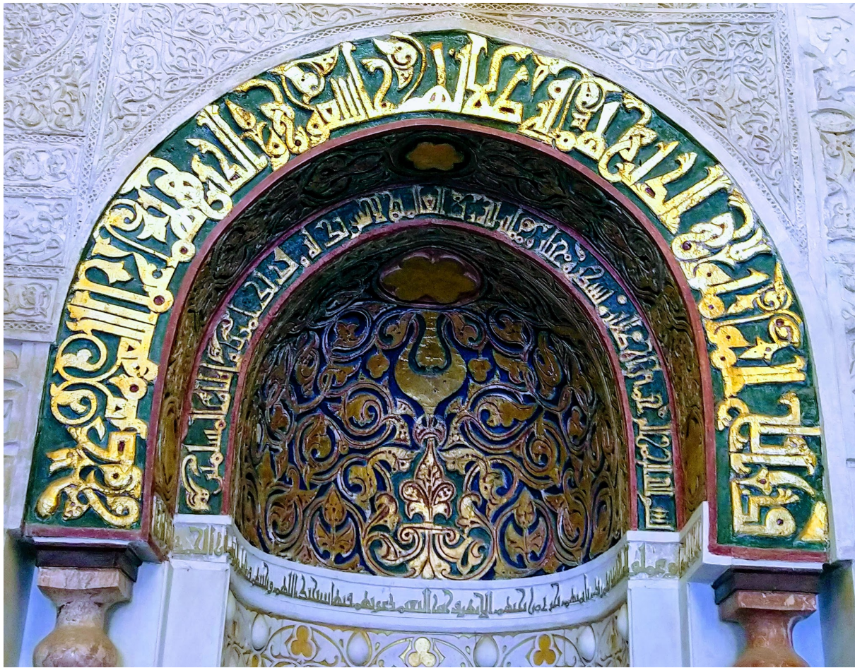
كُتَابَات بِالْكُوفِي الْفَاطِمِي مِنَ الْجَامِعِ الْأَزْهَرِ